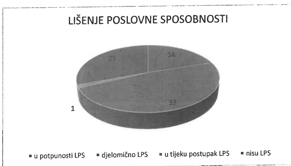
Grafikon 1: Korisnici smještaja u odnosu na poslovnu sposobnost

Od ukupnog broja smještenih korisnika njih 33 je djelomično lišeno poslovne sposobnosti, u potpunosti lišeno poslovne sposobnosti je 14 korisnika (za njih su pokrenuti postupci vraćanja poslovne sposobnosti sukladno zakonskim propisima no isti još nisu okončani), a 21 osoba na smještaju nije lišena poslovne sposobnosti. Za jedno je osobu u tijeku postupka lišavanja poslovne sposobnosti.